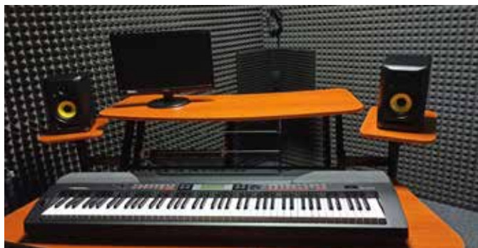
Studio nagraniowe w bibliotece.

Właśnie zakończyliśmy realizację projektu doposażenia Warckiego Centrum Kultury w ramach programu Ministerstwa Kultury i Dziedzictwa Narodowego pod nazwą zawartą w tytule do niniejszego artykułu za kwotę 210.000,00 zł. Głównym celem zadania było stworzenie optymalnych warunków dla działalności naszego ośrodka kultury, aby skutecznie prowadzić działalność w zakresie animacji kultury i edukacji kulturalnej. Zadanie pozwoliło na zwiększenie standardu prowadzonej działalności. Dzięki realizacji zadania zwiększona została dostępność oferty kulturalnej Warckiego Centrum Kultury, w tym dla osób ze szczególnymi potrzebami. Wykonaliśmy także prace remontowe konieczne z uwagi na zły stan techniczny niektórych części budynku. Zakupiliśmy kompletny zestaw nagłaśniający do sali widowiskowej WCK oraz oświetlenie sceny, a także wyposażyliśmy salę do zajęć wokalnych w sprzęt nagłaśniający i mikrofony. Wyposażenie sali do zajęć plastycznych w tablety, ekran multimedialny i drukarkę oprócz tradycyjnych form da nam możliwość prowadzenia lekcji w sposób cyfrowy. Wszystko to ma na celu poprawę jakości naszej oferty kulturalnej zarówno w sferze organizacji imprez jak i prowadzonej działalności edukacyjnej. Konieczne było również wyposażenie sali nagrań, zajęcia wokalne są nierozdzielnie połączone z ich nagrywaniem, dlatego zaplanowaliśmy komplementarne działania, aby uatrakcyjnić ofertę zajęć i warsztatów.