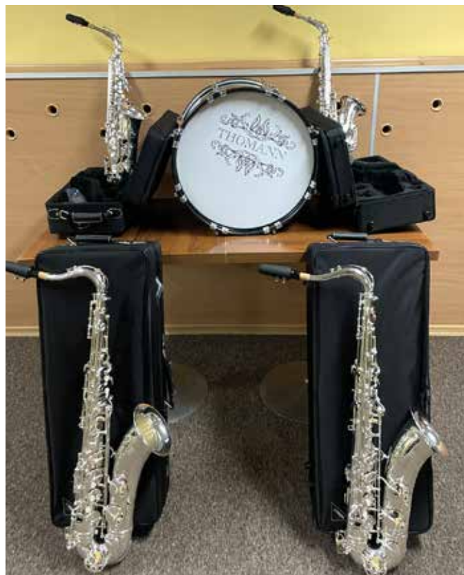
Najnowsze instrumenty dla naszej orkiestry.

wania do odnawiania starych fotografii na cieszącym się coraz większym zainteresowaniem portalu Watronalia. Chcemy stworzyć nowoczesne miejsce, tak aby biblioteka jeszcze lepiej, pełniej i nowocześniej spełniała swoją funkcję. Jest przecież miejscem gdzie nierzadko odbywają się wydarzenia związane z edukacją kulturalną, społeczną i historyczną dlatego tak ważne jest dla nas, aby posiadała odpowiednie narzędzia cyfrowe wspomagające te procesy. Wszak mamy XXI wiek, czas ogromnego przyspieszenia technologicznego, nowych rozwiązań i szans stojących przed edukacją, dlatego też inwestowanie w rozwój nowych technologii informatycznych staje się jednym z najważniejszych założeń polityki edukacyjnej i kulturalnej.